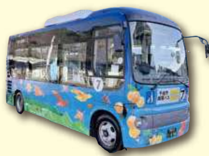
更級戸倉線「やまびこ号」